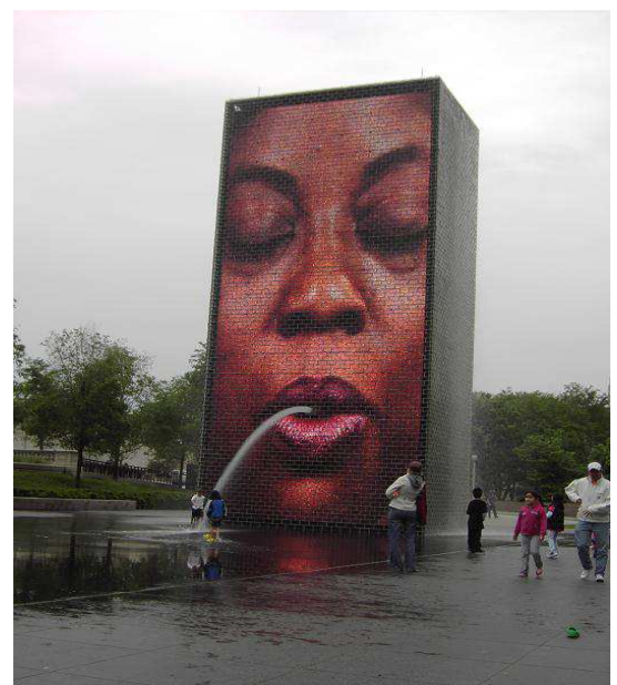
Crown Fountain im Millenium Park